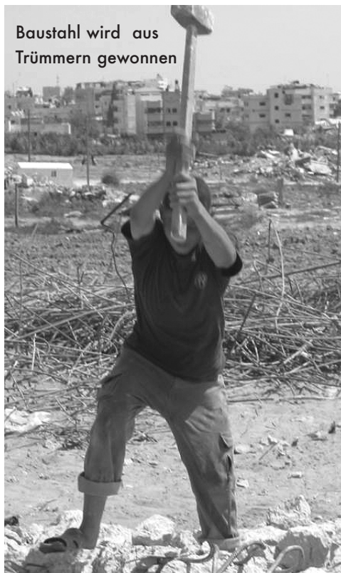
Baustahl wird aus Trümmern gewonnen